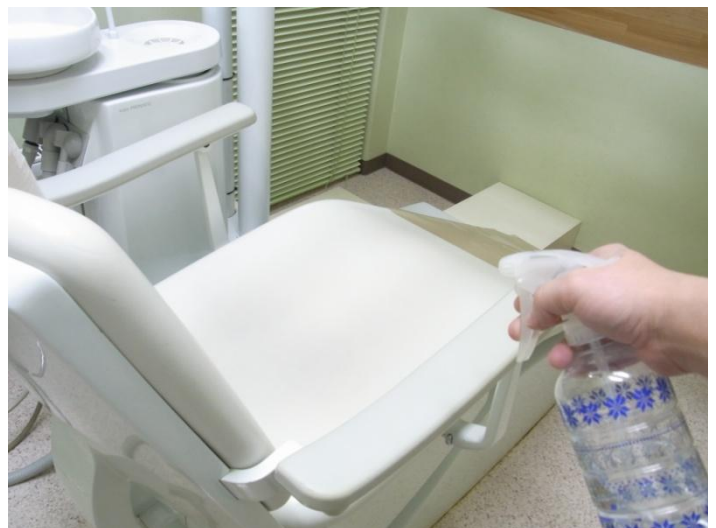
各ユニットは、患者様お一人お一人の治療終了後に毎回治療台及び治療台周りを必ず専用の細菌ウイルス対応消毒剤にて、除菌・消毒を行っています。