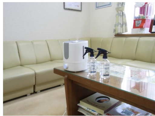
手・指の消毒液を各所に設置しています また、HCL O超音波霧化器を設置し 常時、空気中の除菌を行っています。