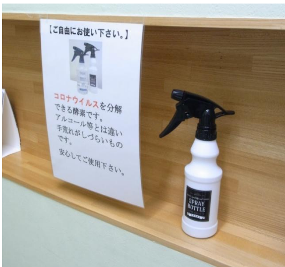
各診療室にも消毒液を設置しています。