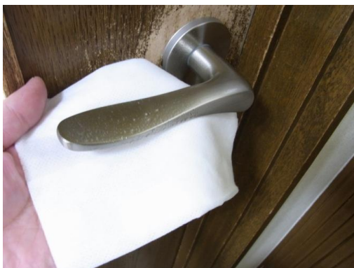
一定時間ごとに取っ手やドアノブの除菌を行っています。

また、気になる方には院内に手・指用の専用消毒液を各所に設置しており患者様が常に手・指の消毒ができるよう環境を整えております。