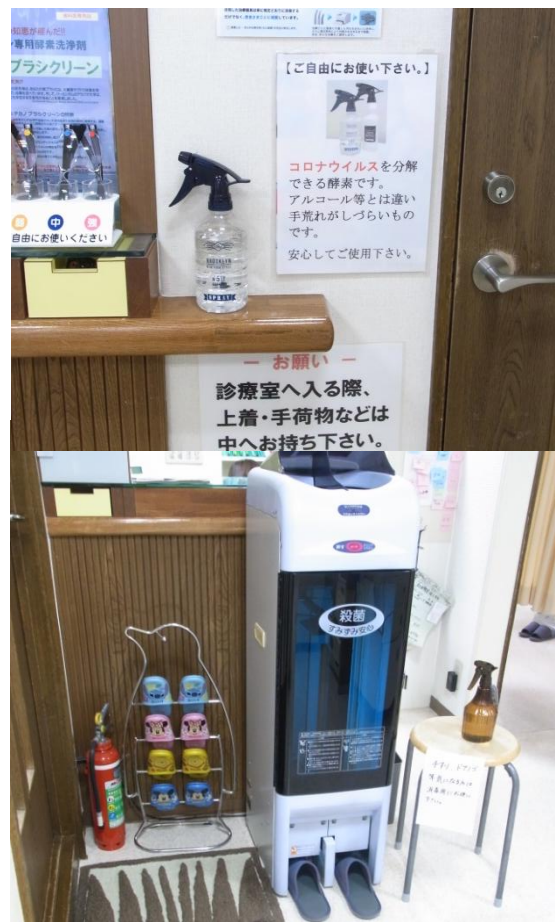
待合室から診療室への入り口・出口にも消毒液を設置しています。