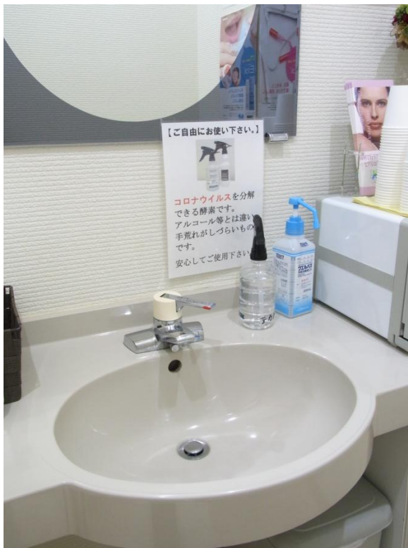
待合室はもちろん、ブラッシングルームにも消毒液を設置しています。